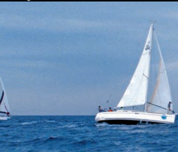
Targa Florio del Mar

dulce del territorio trapanés compuesto por un hojaldre frito, relleno de requesón azucarado y aromatizado. Ferias y convenios se le encargan a la iniciativa de la Administración local, su programación es anual.