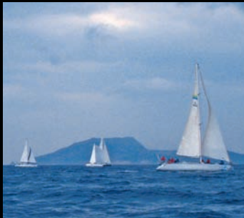
Trofeo Challenge Ignazio Florio