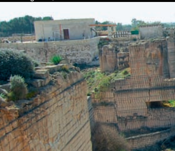
Favignana, canteras de toba

bloques, el material se exportaba a Sicilia y a Túnez. En la actualidad el espectáculo paisajista de las áreas de extracción es realmente sugerente, la vegetación asentada en las cavas y la luz cambiante del sol confieren a estos escenarios un color siempre diverso, en un espectáculo que cambia según las horas del día.