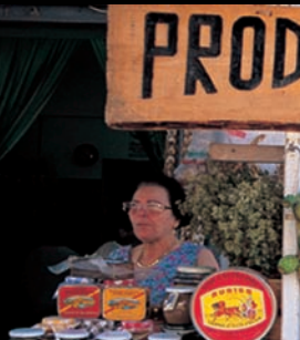
Productos de atunera

por doquier se puede degustar el pescado fresco, a menudo con su sabor enriquecido con plantas aromáticas recogidas en los altiplanos circunstantes (menta, tomillo, romero). Una especialidad es además la pasta con erizos de mar: espaguetis blancos condimentados con huevas de erizo con un intenso sabor a mar.